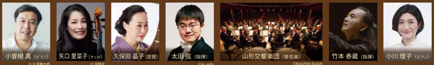
主催：山形県総合文化芸術館オープニング事業等実行委員会 / 山形県総合文化芸術館 指定管理者 みんぐるやまがた 後援：山形県

歴史と文化が薫るまち山形で生まれる新たな音楽祭! 秋の心地よい風を感じながら、“芸術の森”へ出かけてみませんか?